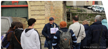
© Terre de Flandre - Ch'ti tour