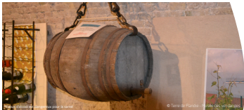
Musée d'histoire et d'agriculture pour le vin